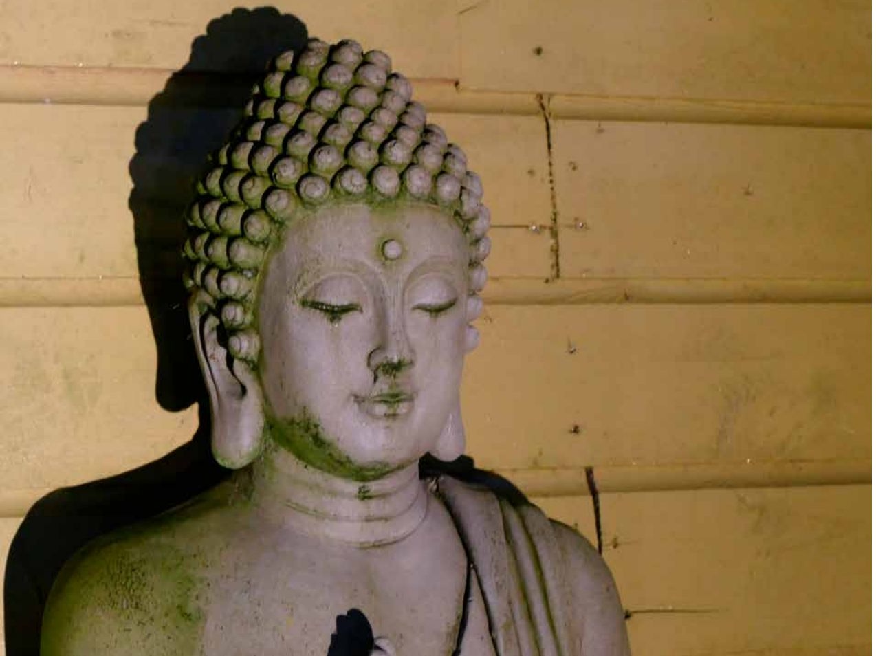
Het huilende Boeddha-beeld

‘Ik doe nu wat me ingegeven wordt, hoe onlogisch dat af en toe ook lijkt’